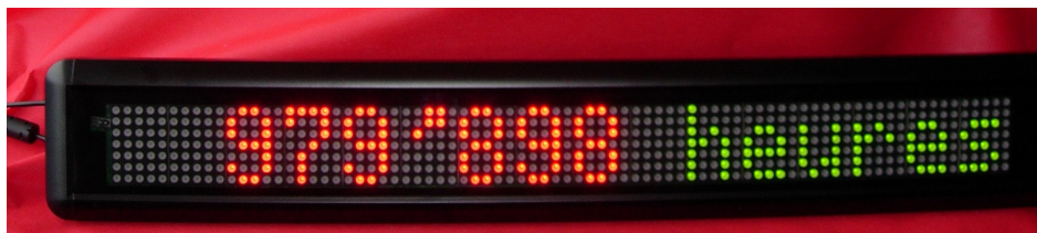
Figure 1: décompte des heures bénévoles au 14 février 2011

Afin de devenir vraiment représentatif du bénévolat dans le canton de Fribourg, le RBN aimerait s'ouvrir en 2011 aux associations oeuvrant dans les domaines culturel, sportif et religieux.